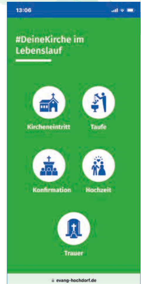
Der Bereich „#Deine Kirche im Lebenslauf“

Besonders wichtig war es uns, dass unsere neue Homepage immer aktuell ist. Deshalb arbeiten wir als Kirchengemeinde mittlerweile ausschließlich mit einem elektronischen Kalender, dessen Termine automatisch auf unsere Homepage übertragen werden und zwar genau dorthin, wo sie gebraucht werden. Im Bereich „#Deine Kirche im Lebenslauf“ finden Sie beispielsweise alle unsere zukünftigen Tauftermine bis Ende 2024. Oder im Bereich „Gemeindeleben“ finden Sie alle anstehenden Termine unserer Gruppen, Kreise und Musikschaffenden.