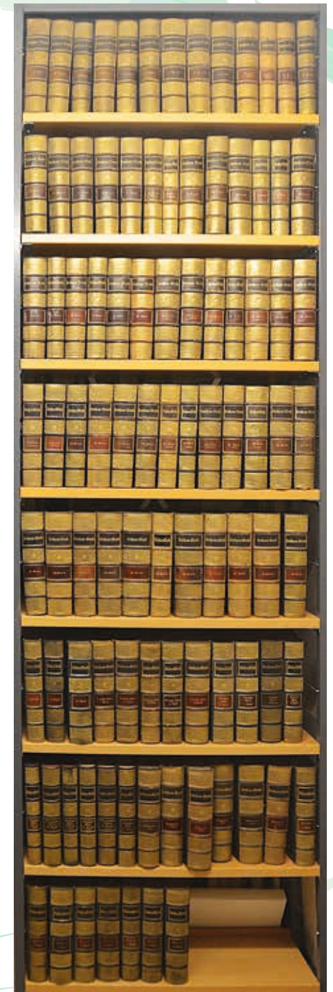
Luthers Werke, Gesamtausgabe