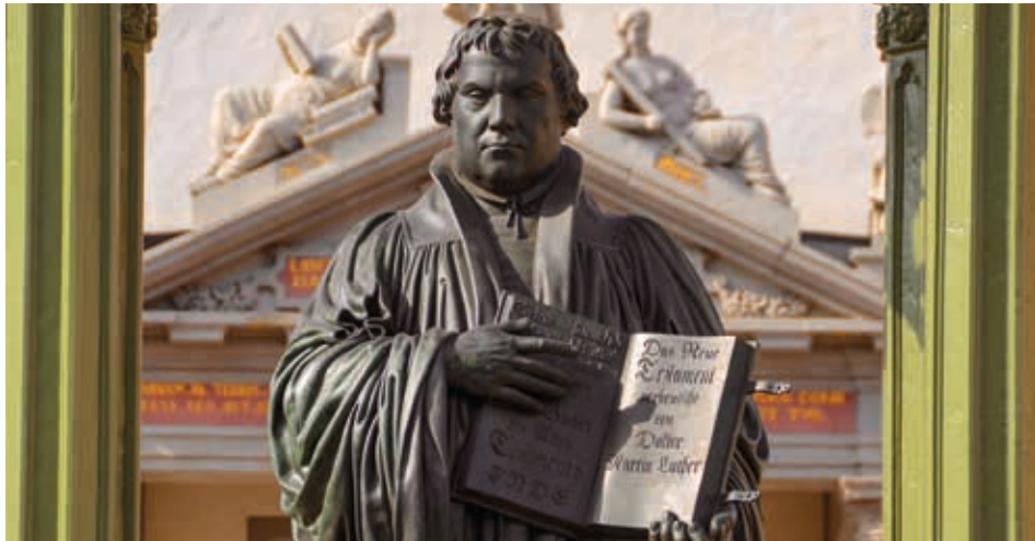
Martin Luther mit dem Neuen Testament auf dem Wittenberger Marktplatz

Am 31. Oktober haben wir wieder Reformationstag gefeiert. Zum 506. mal. Bei uns in der Verbunkirchengemeinde heißt das traditionell Reformations-Sonntag in Schietingen. Mit einem Gottesdienst und anschließendem gemeinsamem Mittagessen im Gemeindetreff, wo uns die Feuerwehr wieder wunderbar bekocht hat.