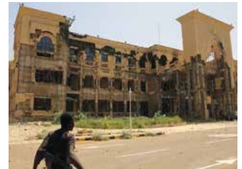
Ein zerstörtes Gebäude in Khartoum