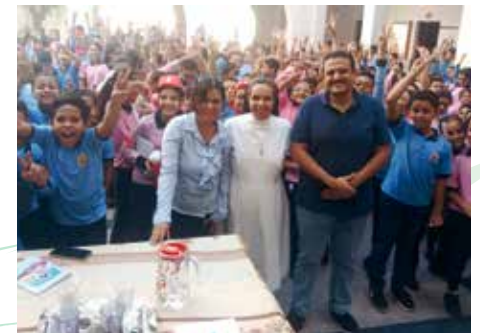
Im Krankenhaus in Naqada/Ägypten