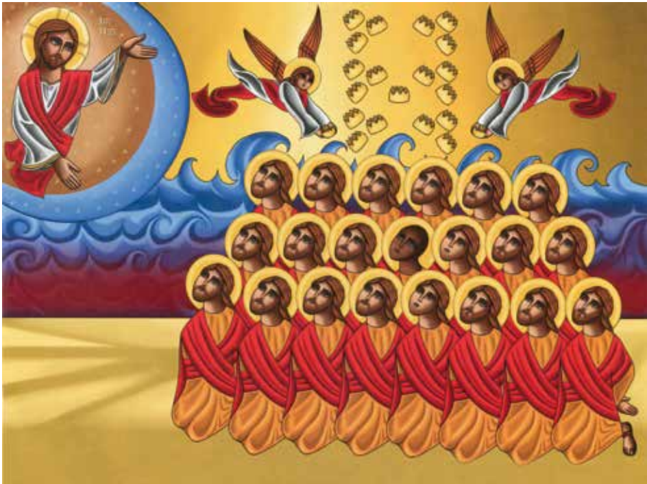
„21 koptische Märtyrer“

Wie Pfingsten Menschen nachhaltig verändert