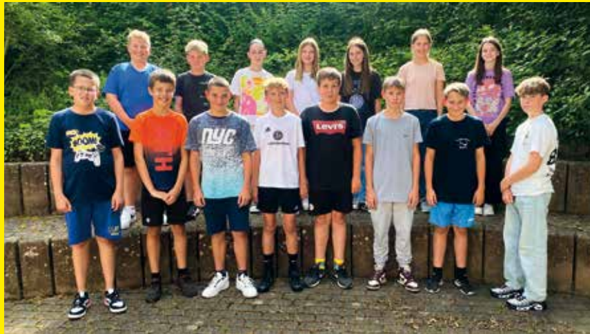
Der Konfi-Jahrgang 2023/2024

am 28. April in Schietingen und am 5. Mai in Hochdorf