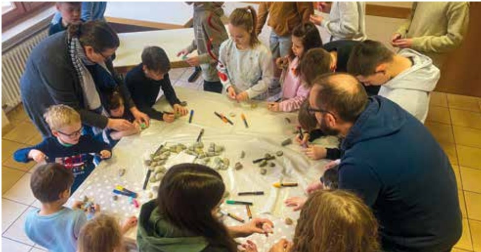
Steine bemalen mit Acrylfarben – Fotos: Larissa Auberger, Fabian Keller

am 18. Februar im Hochdorfer Gemeindehaus