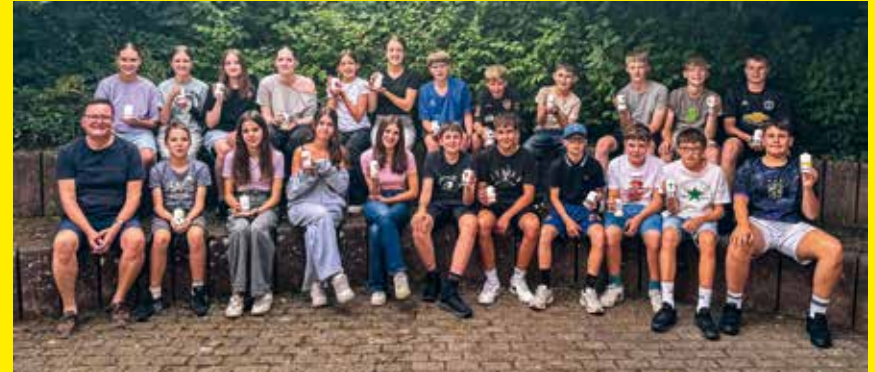
Der Konfi-Jahrgang 2025/2026

Am Sonntag, 3. Mai 2026 werden um 9.30 Uhr in der Michaelskirche Hochdorf folgende Konfirmandinnen und Konfirmanden von Pfarrer Fabian Keller konfirmiert: